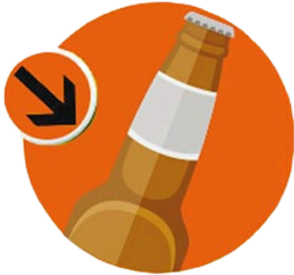
Bouteille en verre